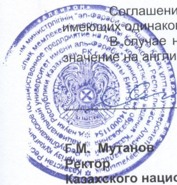
Б.М. Мутанов Ректор Казахского национального университета имени аль-Фараби

Соглашение составлено в четырех экземплярах на русском и английском языках, имеющих одинаковую силу, по одному для каждой из Сторон. В случае наличия расхождений значений между аутентичными текстами, принимается значение на английском языке.