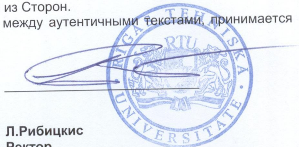
Л.Рибикис Ректор Рижского Технического Университета